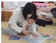
6日 正月遊び バクバク獅子舞作り