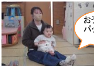
おうまさん パッカ パッカ