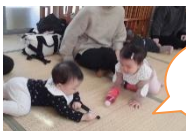
おもちゃ 待て待て～