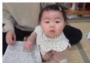
14日赤ちゃんデー ～おもちゃ作り～ (マラカス)