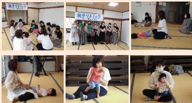
9日 お父さん講座「親子体操」