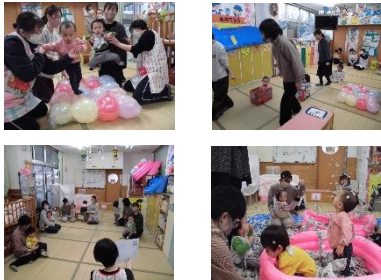
自由来園・ミニイベント