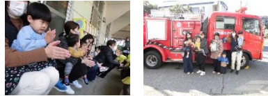
15日 1・2さいデー(運動遊び)